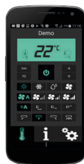
Appstyrning via Wi-Fi ingår. Finns till både Iphone och Android.

*För att garantin ska gälla behöver du serva värmepumpen efter tre år. Regelbunden service gör också att du sänker dina värmekostnader samtidigt som du minskar risken för driftstopp.